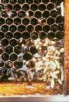
Petekte küçük kovan böceği larvaları