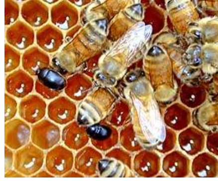
Petek üzerinde küçük kovan böcekleri

Nosema hastalığının ortaya çıkmaması için kovan içinde rutubetin belli bir düzeyin üzerine çıkması önlenmelidir. Kovan içinde yeterince hava sirkülasyonun engelleyen türden malzemeler kovan üst örtüsü olarak kullanılmamalıdır. Kovan yerden en az 30 – 40 yukarıya konmalı, kovan hafif meyilli olarak ve meyil giriş deliği yönünde olmalıdır. Uzun süren yağışlı dönemlerde, kovan giriş deliğinde havalandırılmayı önleyen malzeme varsa yeterince havalandırmanın sağlanması için bu malzeme alınmalıdır. Yağışların geçmesini takiben kovan girişi eski haline getirilmelidir.