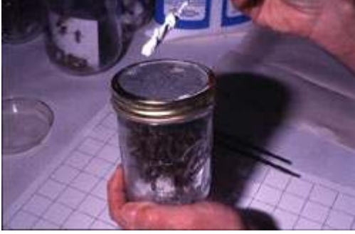
Pudra şekeri ilave edilir

Arıcılarımız bu yeni teknik ile kolonilerindeki Varroa düzeyini kolaylıkla öğrenerek, kolonilerinde Varroa ile mücadele yapmalarının gerekli olup olmadığını öğrendikleri gibi, arılıklarında bulunan kolonilerini ellerindeki sonuçlara göre puanlayabileceklerdir.